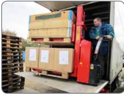
Låg egenvikt betyder bättre utnyttjande av kapaciteten av lastbilens bakgavellyft.