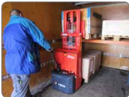
Bättre platsutnyttjande kan betyda färre turer för chauffören.