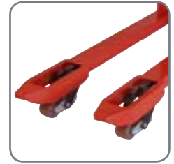
Hög frigång gör det lätt att köra över kanter och köra på ojämna golv.