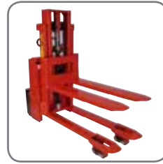
Den låga bygghöjden ger maximal sikt.