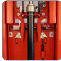
Nyutvecklat patentanmält system ger stabilitet och därmed säkerhet när gods lyfts.